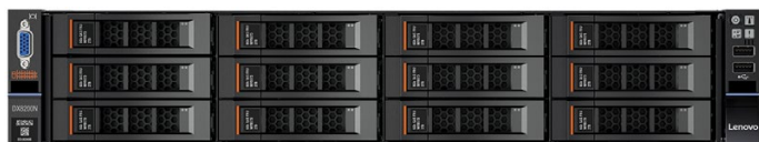
事前テスト、認定取得、事前ロード済み: 実績豊富な Lenovo システム上に構築する NexentaStor 搭載 ブロック/ファイル・ストレージ